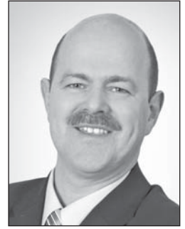
Heinz-Josef Schrammen Bürgermeister der Gemeinde Waldfeucht