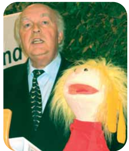
...und seinem Lieblingsprojekt "Toni im Liedergarten."

lassen. Er wurde mit Nadeln und Verdienstplaketten dekoriert, im Jahr 2002 mit dem Bundesverdienstkreuz.