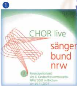
Preisrägerkonzert 6. Landeschorwettbewerb NRW 2001 in Bochum Best.-Nr. CD 2003 1875

Eine SAMMLUNG von CHORAUFNAMEN... ...die jede SÄNGERIN und jeden SÄNGER interessiert!