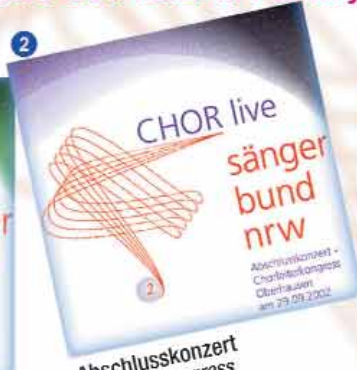
Abschlusskonzert Chorleiterkongress Oberhausen 2002 Best.-Nr. CD 2002 1644