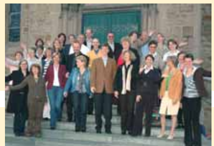
TVE Burgaltendorf "die tonArtisten"

dem Motto "Erst die Stimme trainieren, dann die Fitness! Er sieht darin zwei ideale Möglichkeiten, dem Alltagsstress zu entgehen". Geleitet werden die sportlichen Sänger von Chordirektor ADC Ludger