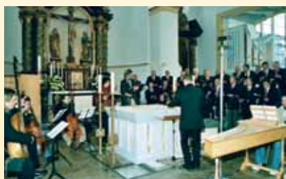
St. Walburga- Kirche in Meschede

Beim Kreissängertag am 17.03.07 stimmten die Delegierten einstimmig für die Umbenennung des Sängerkreises Bonn und Umgebung e.V. in Chorverband Bonn-Rhein-Sieg e.V.