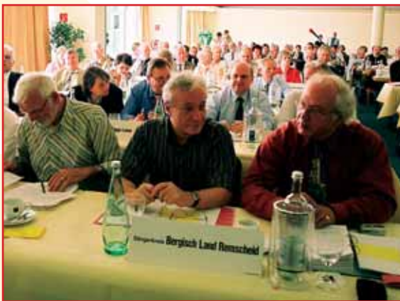
Sie hatten viel zu entscheiden: Die Delegierten des Sängertages in Kaarst.

Dem erweiterten Präsidium des Chorverbandes NRW gehören außerdem an: