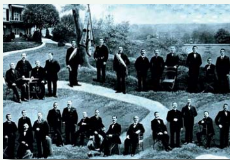
Der Chor vor 100 Jahren

1951, zur 150-Jahrfeier, wurde der Chor nach Nürnberg eingeladen – als Gast der Nürnberger 900-Jahrfeier.