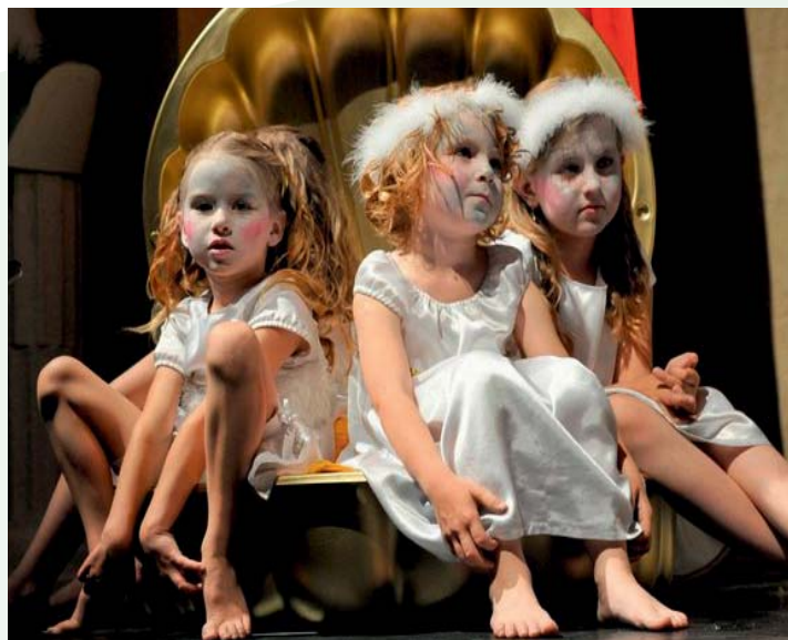
„Piccola Banda“ – Musical-Szene aus Garbeck.